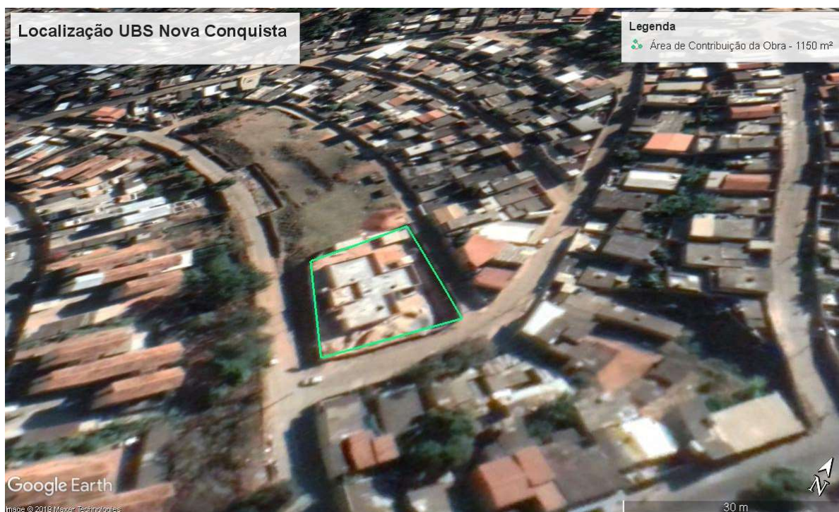
Figura 3 – Áreas de Contribuição Pluvial